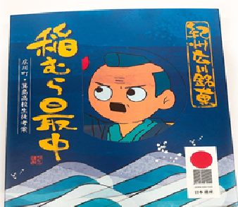
わがまち元気プロジェクト事業（稲むら最中開発）