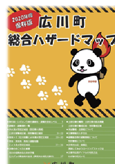
総合防災マップ作成業務委託料