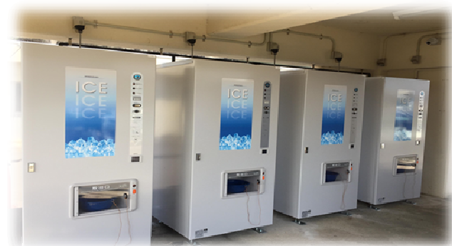
ブルーツーリズム推進事業補助金（製氷施設整備補助金）