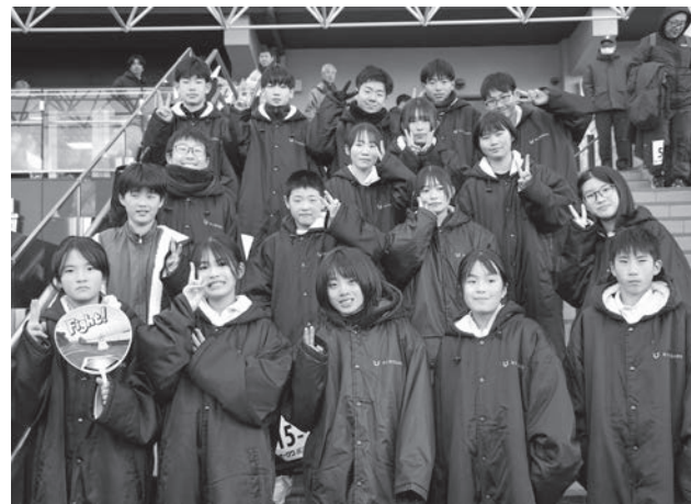
広川町代表チームのメンバーについては、広報ひろがわ2月号で紹介しています

町民の皆さま、あたたかいご声援ありがとうございました。そして広川町代表チームの皆さん、お疲れ様でした。