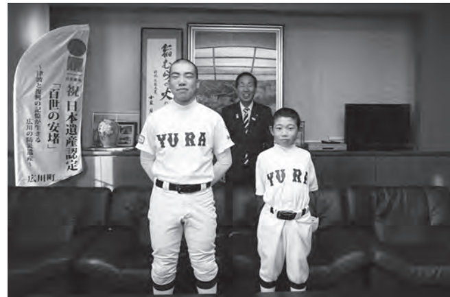
全国大会出場前に西岡町長を訪問