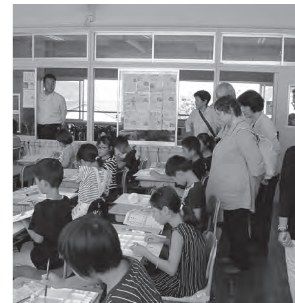
▲学校を訪問する民生児童委員

「こんなこと言ったら、はずかしいよ」とか「みっともないよ」とかよく言われますが、そんなことはありません。民生児童委員には守秘義務があり、皆さんの相談ごとは絶対に他言することはありません。