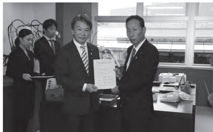
▲国土交通省での認定式の様子

広川町で、歴史的資源を活かしたまちづくりを推進するため、平成20年に施行された「地域における歴史的風致の維持及び向上に関する法律」（通称「歴史まちづくり法」）に基づき認定申請をしていた「広川町歴史的風致維持向上計画」が10月3日に