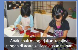
Anak-anak mengerjakan kerajinan tangan di acara kesiapsiagaan tsunami