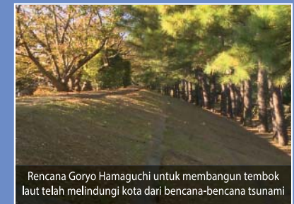
Rencana Goryo Hamaguchi untuk membangun tembok laut telah melindungi kota dari bencana-bencana tsunami