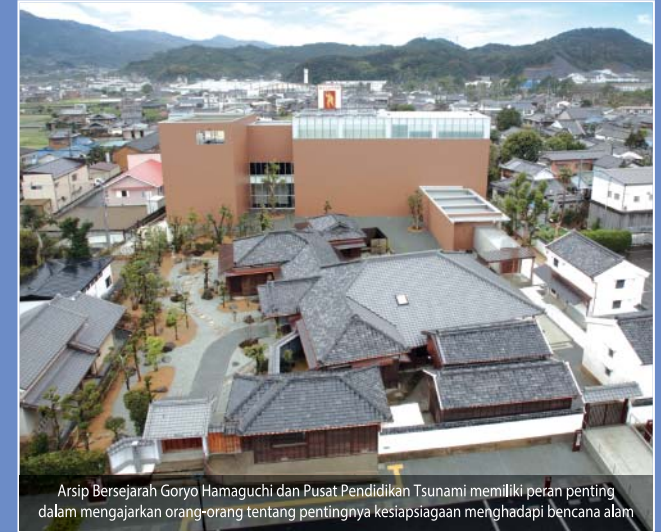
Arsip Bersejarah Goryo Hamaguchi dan Pusat Pendidikan Tsunami memiliki peran penting dalam mengajarkan orang-orang tentang pentingnya kesiapsiagaan menghadapi bencana alam