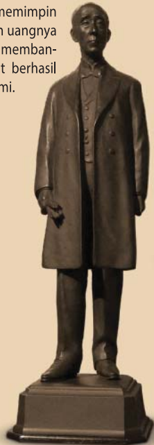
(TULISAN DI PATUNG) Hamaguchi Goryo (1820-1885)