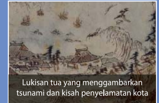
Lukisan tua yang menggambarkan tsunami dan kisah penyelamatan kota