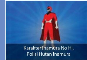
Karakter Inamura No Hi, Polisi Hutan Inamura