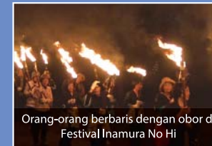
Orang-orang berbaris dengan obor di Festival Inamura No Hi